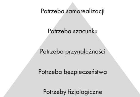
Schemat 1. Piramida potrzeb według Abrahama Maslowa

u młodzieży, ze względu na prawidłowości rozwojowe, nie jest jeszcze w pełni wykształcona.